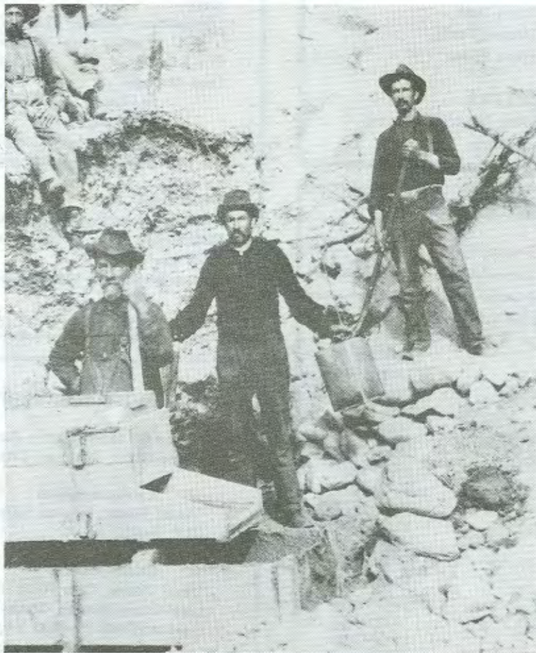
Chercheurs d'or au Klondike