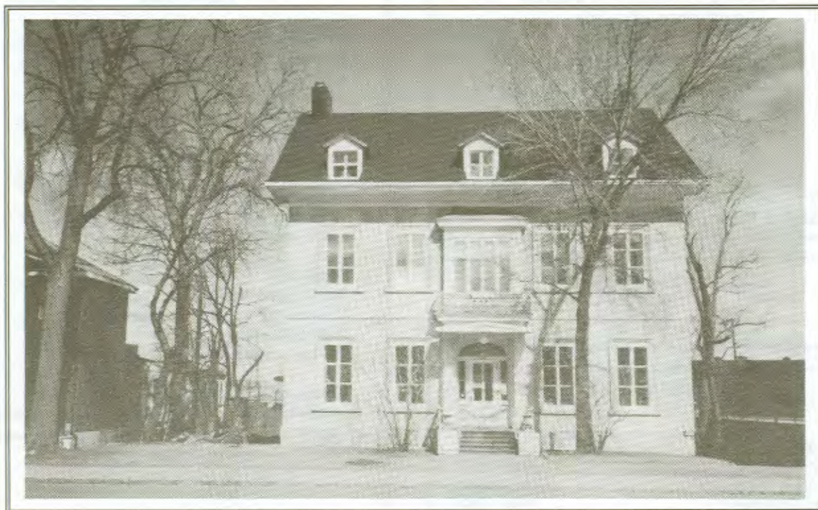
La maison Cannon située sur le chemin Sainte-Foy à Québec