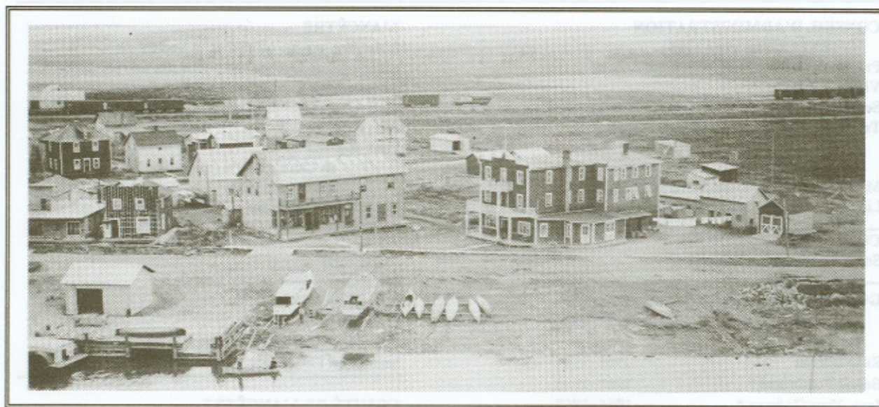
Vue ancienne de La Sarre, Abitibi. On y distingue le quai et le magasin de la Compagnie de la Baie d'Hudson, sur la rive gauche de la rivière, en face de l'église. (Photo Antoine Paquet, La Sarre, vers 1930).