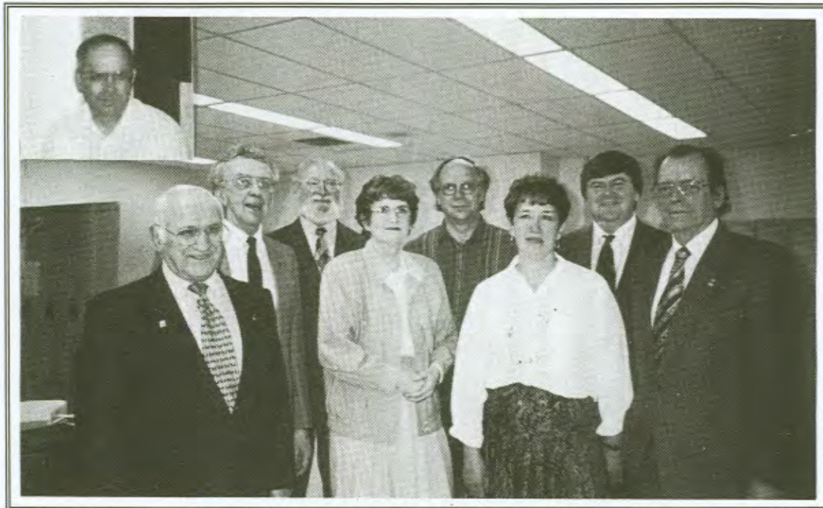
Conseil d'administration 1996-1997 (Légende page 400)