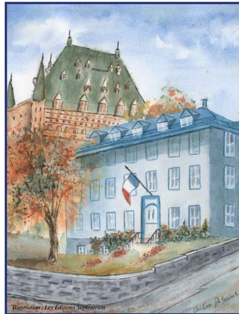
Illustration: Les Éditions Septentrion

Le mardi 8 septembre 2009 à l'auditorium du Musée de la civilisation