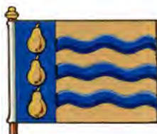
b) Drapeau inspiré des armoiries