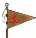
c) Fanion avec insigne