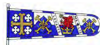
c) Étendard composé des armoiries, du cimier, de l'insigne et de la devise