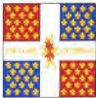
Compagnies franches de la marine, vol. V, p. 209.