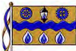
b) Drapeau aux armes