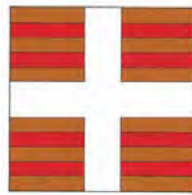
Régiment de Béarn vol. V, p. 212.