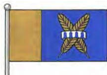
b) Drapeau chargé de l'insigne