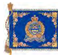
d) Drapeau avec l'insigne du Service de police

City and Police Service of Medicine Hat (AB), vol. III, p. 260 et 264.