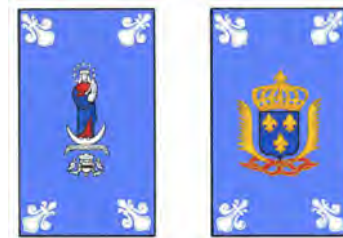
Drapeau de Carillon, vol. V, p. 207.

(ex. 1d et 2d). Ils peuvent notamment être utilisés dans des processions. La bannière religieuse de Carillon, créée pour être suspendue verticalement, est de ce type 3 . Selon la légende, elle aurait été témoin de la victoire de Montcalm sur l'armée britannique à Carillon, en 1758.